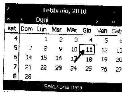
Figura 1 - Icona del calendario

La voce di menu Help consente di visualizzare il presente manuale.